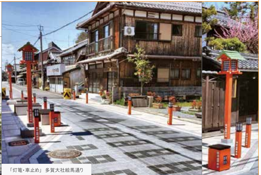
「灯籠・車止め」多賀大社絵馬通り