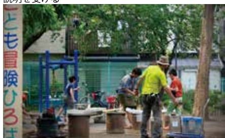
公園で水飴の作り方を教わり自分たちで作って食す子供達

私は、少し前まである地方にある専修学校の建築学科にて教鞭をとりながら、浜松市の「景観」がどのような場所でどのように形成されているのか調査し、問題点をまとめてきた。その資料で生徒たちと一緒に、自分たちの住んでいる浜松市の「景観」形成の現状について考えてきた。さらに静岡県全域中で行われている「景観」形成とその行政が行っている「景観」形成とは何が違うのかについてもまとめた。この活動の中で、ここの行政において「景観」と呼ばれているものは、歴史的建築物や街並みの保存、サインや屋外広告物、街路樹などによる緑化計画など、今まで建築・土木の分野の中におかれてきた結果、都市計画の分野から漏れ落ちてしまったもののみだということが分かってきた。また、その漏れ落ちたものは個別に評価されてしまい、「トータルなまち並み＝「景観」形成」としてみなされていないことがわかってきた。行政のまちづくりを構想するための財政問題もあるが、「トータルなまち並み＝「景観」」形成を行う思考欠如が垣間見えた。