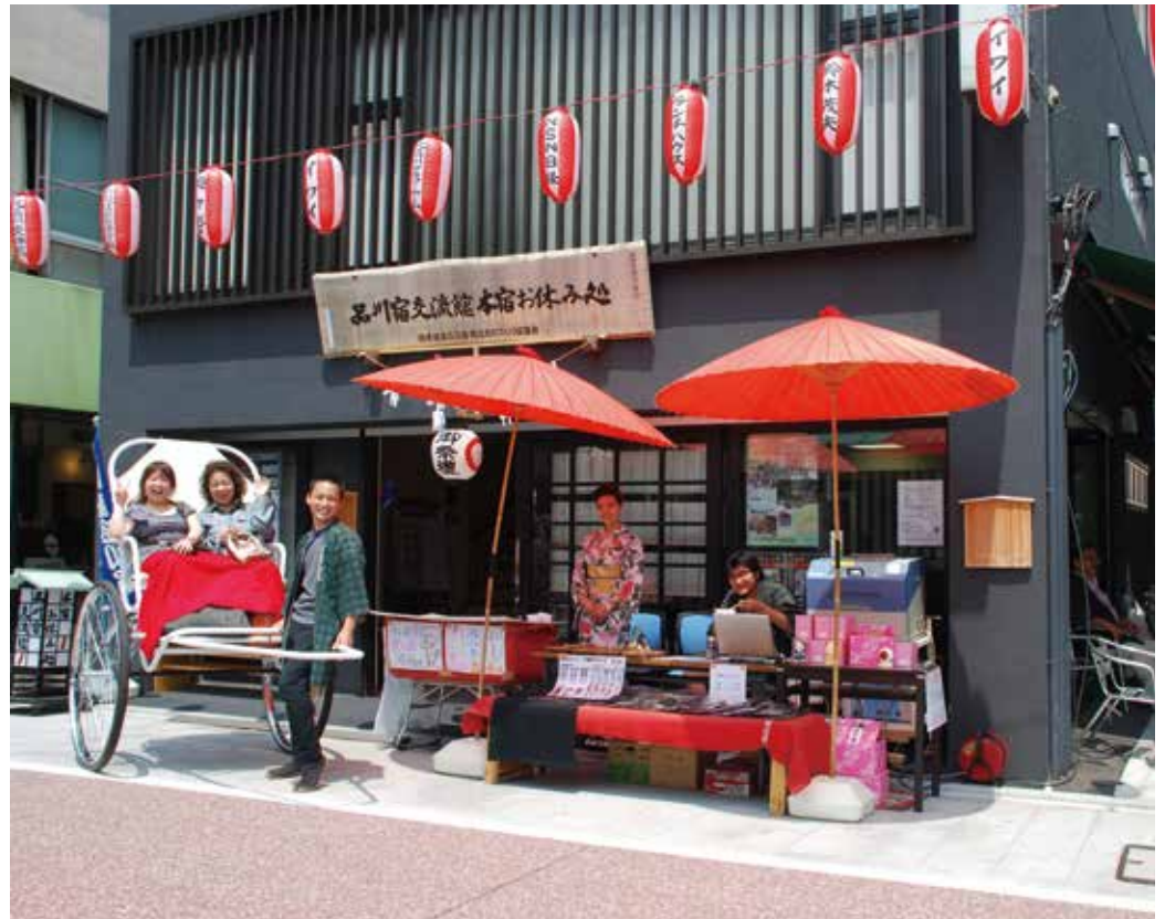
まちづくり活動の拠点「品川宿交流館」(「宿場祭り」を前にして)