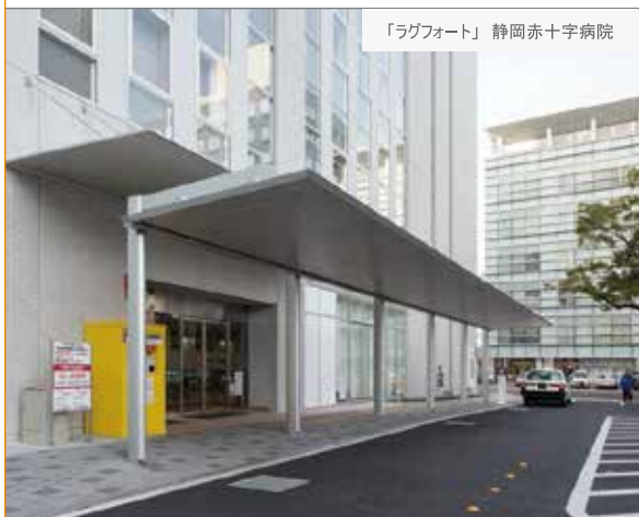
「ラグフォート」静岡赤十字病院