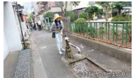
今も使える路地奥の井戸

またJR品川駅徒歩圏の立地から、大規模な住宅開発が多く、流入人口は増加傾向にあり、新旧住民の混在で、祭りにも多くの子供たちが参加する元気なまちです。