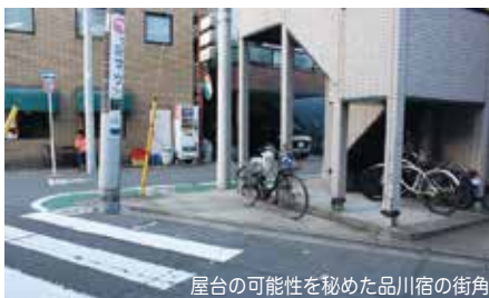
屋台の可能性を秘めた品川宿の街角

他にも、品川は昔、屋台が数多く立ち並ぶ宿場町として機能していたが、天王洲と品川埠頭側にはそのような商業の賑わいが無い。今は品川にも屋台は1軒しか残っていない。そこで僕が携わった設計課題では、北品川の商店街に着目し、それぞれの地域を繋ぐ媒介として屋台を設計した。飲食や小商いの集うイベント感覚の場で、人びとの生活の場とは切り離されていた屋台が新たな商業機能を生み出す、多様性のある移動式商店として提案した。北品川には八百屋、マッサージ店、居酒屋、コーヒーショップ、定食屋、自転車修理屋といった数多くの活気ある商店が立ち並ぶ。それらの既存の物や人といった資源を屋台に組み込んで活用する。屋台が挿入する場所は、エリアを大まかに旧街道、品川浦、埋め立ての北品川、天王洲、品川埠頭がありその中でも、品川には現在、隙間と言えるような場所が数多く存在する。北品川の空き地だけで約50箇所、品川浦では行き止まりの路地が25箇所、北品川の埋め立てエリアで見ると昔の海岸線のエリアによってできた三角のヘタ地だけでも30箇所存在している。