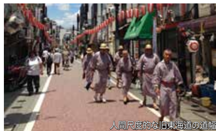
人間尺度の旧東海道の道幅

旧東海道は、海岸が近く緩やかに蛇行している尾根道で、江戸時代からのヒューマンスケールな道幅を今も守っています。