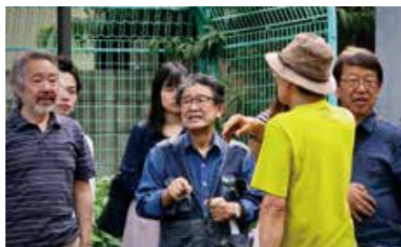
品川区北浜公園にてプレイパークを管理する方から説明を受ける