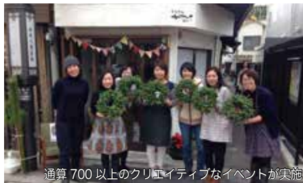
通算700以上のクリエイティブなイベントが実施

「うなぎのねどこ」は旧東海道第一宿場町の品川宿にある築100年の空町家店舗をリノベーションしたイベントのできるコワーキングスペース。2015年7月にオープンし、関わる人の夢を叶えながら、まちと人、人と人をカジュアルにコネクトする「場」として成長しています。