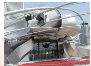
F・O・ゲーリーの野外劇場