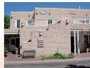
アルバカーキの原初の家