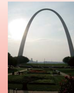
セントルイスのアーチ