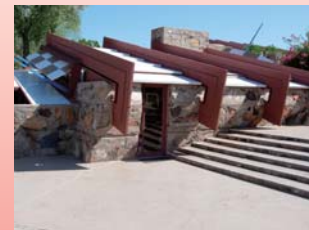
タリアセン・ウエスト