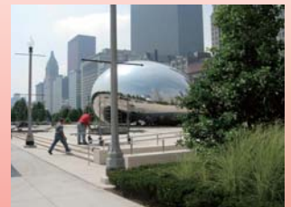
アニッシュ・カプーアの作品